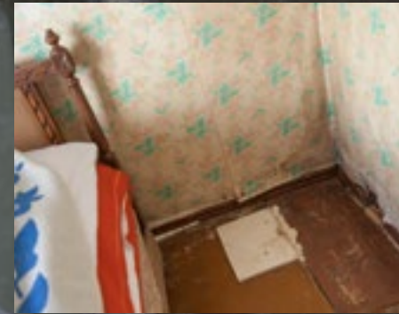
◀ Rodents and bugs were infested in the bedroom, due to the mold and holes around the decaying structure. / Միջատներն ու առնետները անպակաս էին ննջարանէն՝ փտած կառոյցի համատարած մզլոտութեան ու ձեղքերուն հետեւանքով:

Սեպտեմբեր 11, 2015-ը երբեք պիտի չջնջուի Խանագյաններու յիշողութենէն: Այդ օրը անոնք հրաժեշտ տուին իրենց 27-ամեայ ժամանակաւոր տնակին եւ փոխադրուեցան Նոր յարկաբաժին մը՝ շնորհիւ ամերիկահայ բարերարներ ու բժիշկներ՝ Տէր եւ Տիկին Վարուժ եւ Սվետլանա Մինասեաններու առատաձեռնութեան: Կիւմրիի Մուշ թաղամասին մէջ գտնուող յարկաբաժինը Մինասեաններուն նուէրն էր: Բայց այս անակնկալը կ'ընդգրկէր աւելին, քան ինքնին յարկաբաժինը: Արդարեւ, անիկա