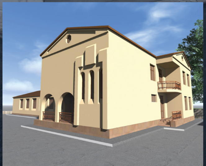
Architectural rendering of the Krasni community center. / Քռասնիի համայնքային կեդրոնի ճարտարապետական յղացքը: