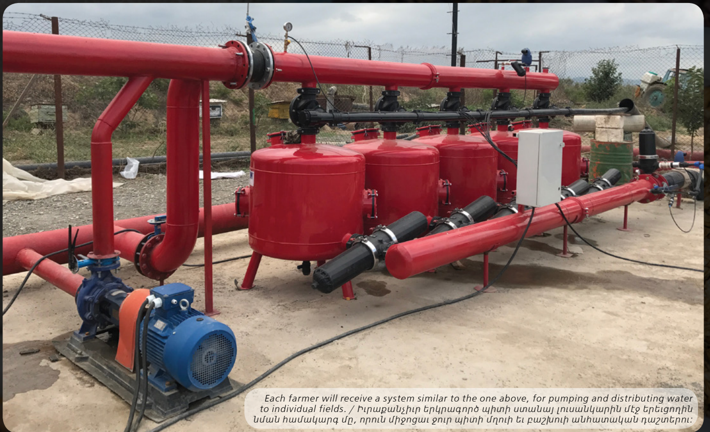
Each farmer will receive a system similar to the one above, for pumping and distributing water to individual fields. / Իւրաքանչիւր երկրագործ պիտի ստանայ լուսանկարին մէջ երեւոյթին նման համակարգ մը, որուն միջոցաւ ջուր պիտի մղուի եւ բաշխուի անհատական դաշտերու:

Արցախի խորքային հորերէն իւրաքանչիւր կրնայ ոռոգում հայթայթել մինչեւ 60 արտավար հողի համար: Ներկայիս երկրի հողամշակները մէկ արտավար հողէն միջին հաշուով միայն $120 շահոյթ ունին: Պատճառը այն է, որ հողամշակները ստիպուած են ցորեն, գարի, եւ քիչ շահ բերող նմանօրինակ բոյսեր մշակել՝ հիմնականօրէն անձրեւաջուրի վստահելով, փոխանակ մշակելու բարձր շահ ապահովող բայց առատ ոռոգում պահանջող բոյսեր, ինչպէս օրինակ՝ բանջարեղէն, պտուղներ, ինչպէս նաեւ կաղիւն, ընկույզ, նուշ, եւ պիստակ: Կաթիլային ոռոգման համակարգերը օրինութիւն մը պիտի ըլլան Արցախի երկրագործներուն համար, թոյլ