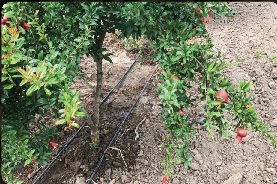
Water is then distributed through tubes. This allows for water to drip slowly to the roots of plants, either from above the soil surface or buried below the surface. / Ջուրը ապա կը բաշխուի խողովակներով: Այսպես, ջուրը դանդաղօրէն կաթելով կը հասնի բոյսերու արմատներուն, բխելով գետնի մակերեսին վրայէն կամ գետնին տակէն:

plastic pipes with tiny holes on the bottom. As the water flows through the pipes, it drip-irrigates the ground on which they're installed. Therefore the water feeds the plant by dripping directly above the root, without being wasted or vaporized.