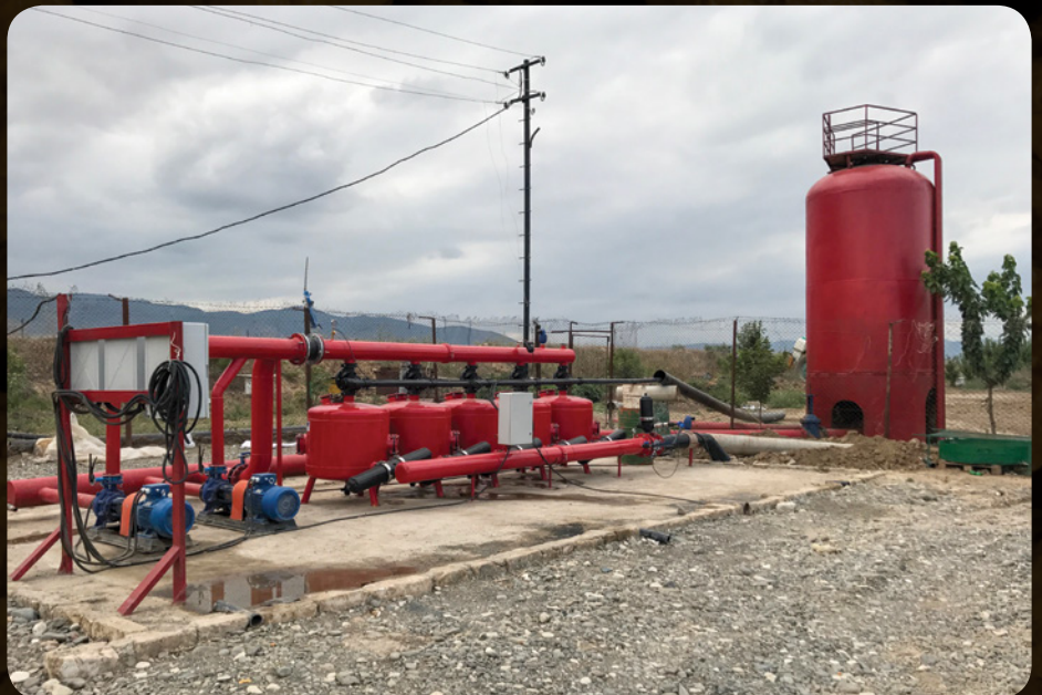
The drip-irrigation system first pumps water from underground. / Կաթիլային ոռոգման համակարգը նախ ջուր կը մղէ գետնին տակէն:

In its first five-year phase of implementation alone, "Fruitful Artsakh" is expected to create close to 6,000 jobs and increase crop-raisers' profits up to twentyfold. As significantly, the project is poised to have a proliferating effect, paving the way for an array of auxiliary new industries, services, and infrastructures, and functioning as a template for success which more and more crop farmers across Artsakh and Armenia are certain to go on to emulate.